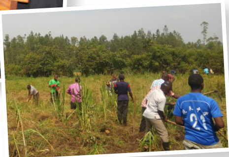
Titelbild: Die Priesteramtskandidaten auf dem Weg zur feierlichen Messe.

Auch im Ausbildungsjahr 2022 / 2023 unterstützt missio München deshalb den Wunsch vieler junger Männer, in den Dienst der Kirche zu treten und trägt mit einem Zuschuss in Höhe von 17.428 Euro zu den laufenden Kosten des Großen Priesterseminars St. Paul Kinyamasika zur Ausbildung von 215 Priesteramtskandidaten bei.