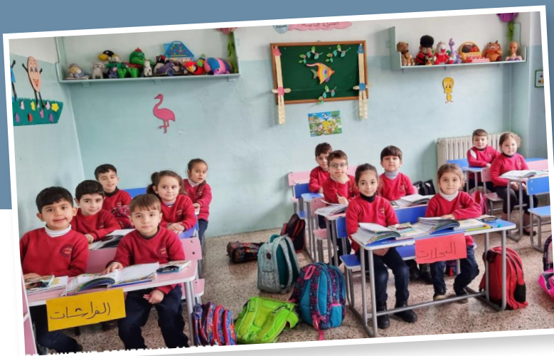
Foto oben: Die St. Vinzenz-Gemeinschaft engagiert sich in verschiedenen Schulen in Aleppo. Rund 1.200 Schülerinnen und Schüler sind auf Hilfe angewiesen.

Im Schuljahr 2023/2024 profitieren insgesamt 6.595 Kinder sowie 305 Jugendliche in ausgewählten Schulen und Hochschulen von dieser finanziellen Unterstützung. Die durchschnittliche Zuwendung liegt bei 43 Euro pro Kind.