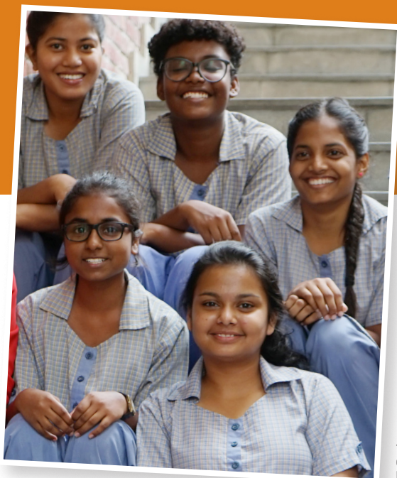
Titelfoto und Foto links: Schülerinnen der Carmel Convent School fotografiert bei einem Projektbesuch im Jahr 2019.

Familien unterrichtet. Die Schwestern legen großen Augenmerk auf einen wertschätzenden Umgang miteinander und eine gute Schulgemeinschaft, in der jeder, unabhängig von der Herkunft, seinen Platz findet. Die Begegnungen sind für alle bereichernd und fördern die Toleranz und das Verständnis füreinander.