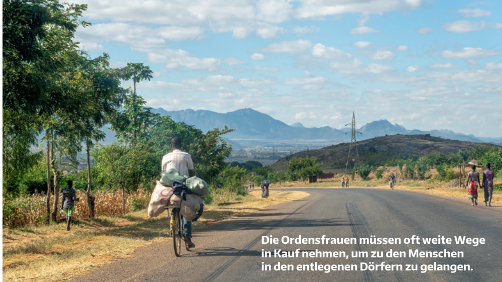
Die Ordensfrauen müssen oft weite Wege in Kauf nehmen, um zu den Menschen in den entlegenen Dörfern zu gelangen.

fügt. Wir brauchen aber ein ausreichendes Einkommen, um zu überleben. Und dafür ist es wichtig, dass die Schwestern gut ausgebildet werden. Viele Ordensgemeinschaften kämpfen mit großer Armut. Wir ermutigen die Schwestern, selbst Landwirtschaft zu betreiben, damit sie überleben können. Auch ich als Oberin der Teresienschwestern habe manchmal die Sorge, nicht alle Schwestern satt zu bekommen.